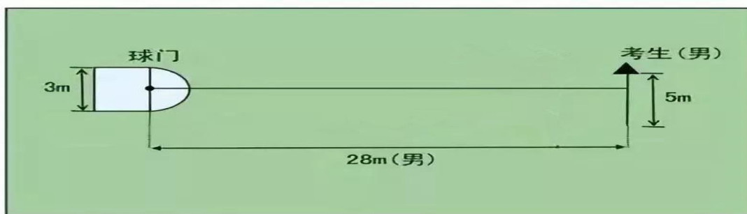
定位 传准 意图

② 分 准：以 从 出后，从 中 到地 一接 为准。 将 传入 区域 半圆内（含 一 在圆周 上），或五人制 （含 击中 或 弹出）即得 2 分。 人 完成 5 传准， 分 10 分。