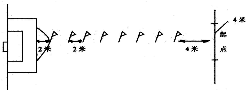
20 射 意图

① : 如图所 , 从 区 中 垂 向场内延伸 20 处, 一 平 于 作为 。 区 2 处 , 20 垂 共 8 志 且 为 2 , 8 4 , 度 为 4 , 垂 于 20 并 与 交。 将 于 上, 依 8 志 后 射 , 动 开 , 当 从 中或地 停 , 录 完成 。 凡 出 、 射 偏 出 , 击 中 或 弹 出, 均 属 , 不 成 。 人 2 , 取 好 成 。